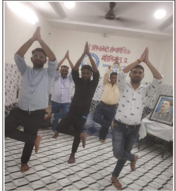
बोर्ड ऑफ इलेक्ट्रो होम्योपैथिक मेडिसिन, उ0प्र0 के ऑफिस में विश्व योगा दिवस के अवसर पर योगा करते हुये बोर्ड का स्टाफ