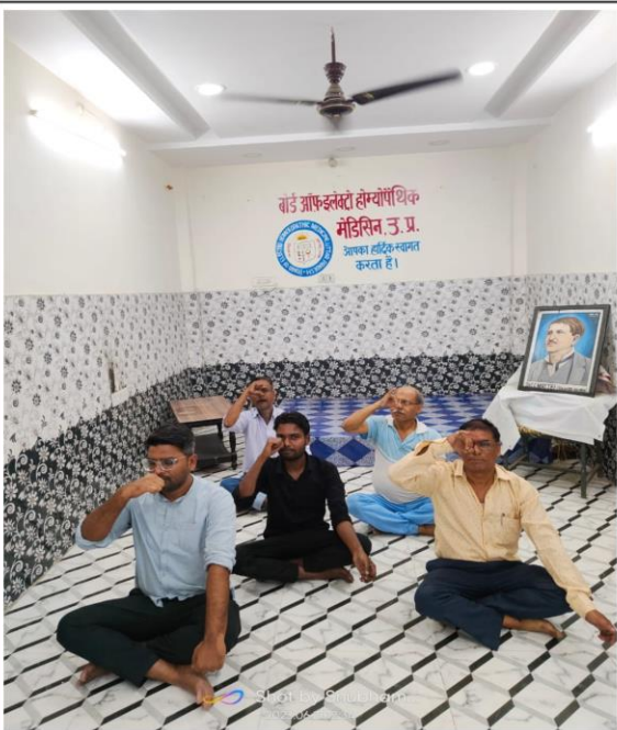
बोर्ड ऑफ इलेक्ट्रो होम्योपैथिक मेडिसिन, उ0प्र0 के ऑफिस में विश्व योगा दिवस के अवसर पर योगा करते हुये बोर्ड का स्टाफ

प्रतिस्पर्धा के युग में यदि हमें जीवित रहना है तो अन्य पद्धतियों की भाँति इसमें भी कार्य करना होगा। उन्होंने कहा कि इलेक्ट्रो होम्योपैथी की औषधियाँ हानिरहित हैं। यह रोगी के शरीर में रक्त और रस को शुद्ध करके रोग को जड़ से समाप्त करती हैं। इस पैथी में दवाओं का निर्माण वनस्पतियों से होता है न कि केमिकल से। इसलिये लोगों का विश्वास इलेक्ट्रोहोम्योपैथी की ओर लगातार बढ़ता जा रहा है।