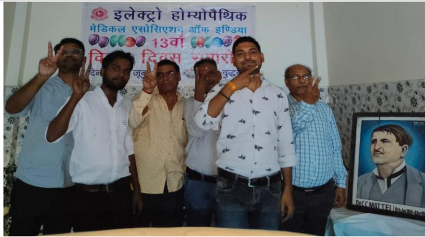
बोर्ड ऑफ इलेक्ट्रो होम्योपैथिक मेडिसिन, उ0प्र0 के प्रशासनिक कार्यालय कानपुर में विजय दिवस पर प्रसन्न मुद्रा में सभी स्टाफ विजय V का चिन्ह दिखाते हुये।

अन्य जनपदों से भी 21 जून को विजय दिवस समारोह मनाये जाने के समाचार प्राप्त हुये हैं, देखे पेज 2 एवं 3